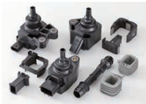
1/100 ミリの精度を実現した当社の製品群

当社はエンジニアリングプラスチック複合精密成形と成形用金型を中心に、多様な工業部品を製造しています。自動車に不可欠なイグニッションコイルや電動パワーステアリングの部品など自動車分野を中心に私たちの技術力が活かされています。成形にとどまらず、金型そのものを自らつくり上げ、自動生産設備の導入を進めることで、お客様が満足する精度を実現。モノづくりに関してどこにも負けない自信があり、大手自動車メーカーからも多大な信頼を受けています。