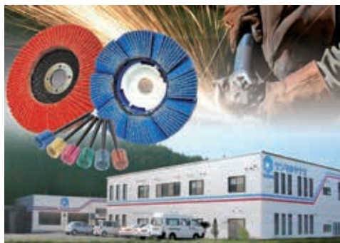
1 日約 3 万個 山南町から全国に出荷しています

当社は、金属や木、ガラスなどの切断や研削・研磨に使用する研磨布紙や不織布を材料とする研磨材を製造・販売しています。製品は、商社や問屋、ホームセンターを通じ国内はもとより海外にも販売しています。