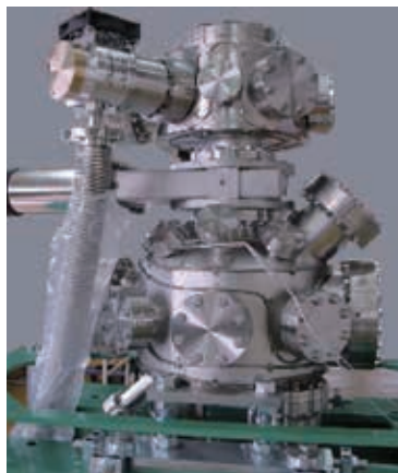
光脱離測定チャンバー

当社は精密機器を設計製作から電子制御まで一貫して独自に開発、製造を行っております。