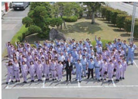
明るく元気でやる気に満ちた貴方を待っています

私たちフルヤ工業の役割は、第一にお客様が求める様々な期待にスピーディーにお応えすることです。そして同時に“お客様の満足”を一層昇華させる「信頼」、すなわち私たちのDNAを守り続けることです。その「信頼」の源は、固有の成形技術による“ハイテクなものづくり”です。そしてクリーンな環境を維持する最新鋭設備の工場から創り出す“付加価値の高い製品”を世に送り出すことです。私たちは、お客様の「夢」をカタチにすることを喜びにしています。