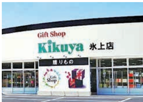
キクヤ 氷上店 《丹波市氷上町本郷 488 番地 1》