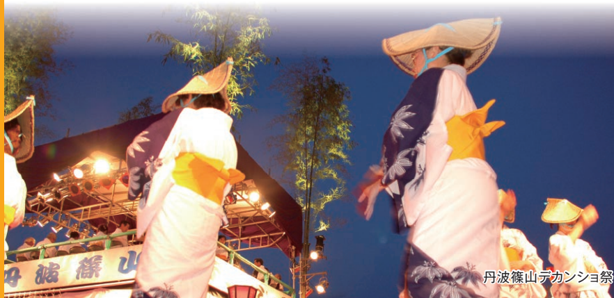
丹波篠山デカンショ祭

そして、丹波の強みはこれら豊かな地域資源を持ちながら、阪神間から鉄道や自動車ですら約1時間半の圏域に位置していることです。単に都心部から丹波に週末に遊びに行くというだけでなく、丹波の魅力にひかれた若い人たちが移り住んで、古民家を改装してカフェをオープンしたり、空き家に移住して農業を始めたりといった事例が増えつつあります。