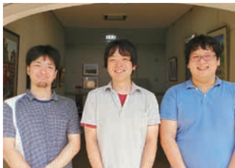
山ゆりホーム スタッフ写真

社会福祉法人 福住山ゆりの里は、豊かな自然の中で「特別養護老人ホーム」「短期入所生活介護(ショートステイ)」「通所介護(デイサービス)」「居宅介護支援」「介護予防」等の事業に取り組んでいます。地域に密着し、安心して彩りのある生活を提供する総合福祉施設です。