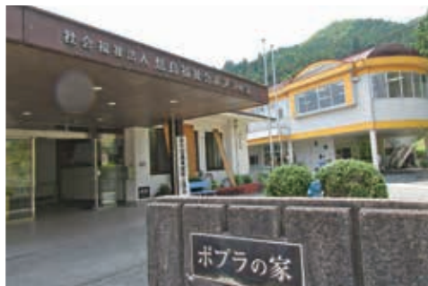
指定障害者支援施設・ポプラの家玄関と 障害者通所施設・たんば園本館

法人が設立され、30年余りになります。この間、通所施設1施設から運営し、それを皮切りに、2つ目の通所施設、親亡き後も365日利用できる入所施設、さらに市内6か所に少人数の利用者が寝泊まりできるグループホームを運営するに至ります。