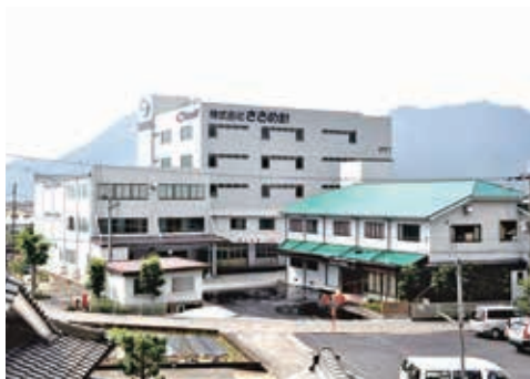
日本での拠点はこの本社のみとなります

日本の釣り人口は約1,000万人といわれ、数々の釣り人が清流や河川、湖沼、そして海で魚釣りというスポーツレジャーを楽しまれております。ささめ針の製品はそのような方々に魚釣りのさらなる楽しさを演出し、大きな感動を与えていけるものと信じております。