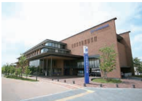
平成19年に三田本部を開設しました

北は京都府福知山市から南は神戸市まで12市2郡の営業エリアに、28の店舗と店外ATMを配置しています。兵庫県中部経済圏に不可欠な金融機関として、また、新しい文化のメッセンジャーとして、健全経営をモットーに「地域社会の繁栄と豊かな暮らしづくり」をお手伝いしております。 また、金融機能の提供だけでなく、伝統工芸、文化、スポーツといった面も視野に入れ、広く地域社会の活性化に取り組んでいます。