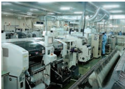
チップマウンターによる電子部品の実装工程

設計から試作・量産までを一貫して社内で行える製造メーカーです。『環境活動』にも力を入れ、定期的に『地域清掃活動』を行っているほか、『電力デマンド監視システム』を設置し、工場内の省エネ節電対策に取り組む等、『地球環境にやさしい製品づくり』を心がけています。