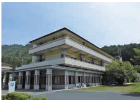
緑に囲まれ、日当たりも良い環境にある「おかの花」外観

おかの花は、丹波市春日町の西北部に位置し、三方を緑豊かな山林・田畑に囲まれた南向きでなだらかな丘陵地にあります。基本理念「愛と協調」～思いやりと助け合いの精神を大切に～、笑顔とあいさつを絶やさず、利用者が安全で安心できる心豊かな生活の実現を目指し頑張っています。