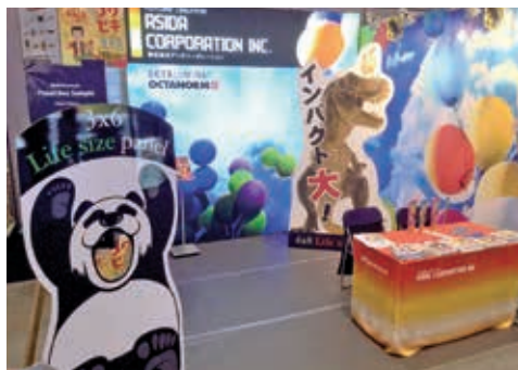
展示会「SIGN EXPO 2017」出展ブース

当社は、販促アイテム・ユニフォームの企画・製造・販売を総合的に展開している企業です。多種多様なアイテムを扱っており、企画から販売までを社内一貫で行うことによって、小ロット多品目に対応できることが強みです。取り扱い製品は、のぼり旗、横断幕、大型ステッカー、プリントウェア（Tシャツ・ツナギ等）などで、多様なサイン広告物を取り扱っております。その中でも布製品への印刷が主力です。「短納期・高品質・低価格」をキャッチフレーズに、常に良質な製品づくりを心掛ける事によって、お客様からより一層信頼していただけるように努めています。従業員のうち、50%以上が女性、20代～30代も約半数と女性や若い人が多く活躍しています。