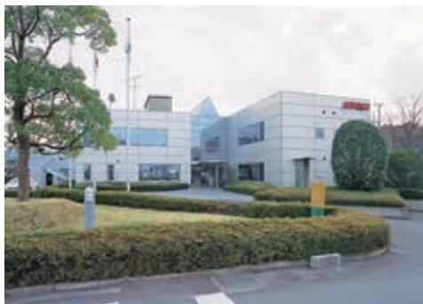
篠山市にある本社外観

肉・魚・惣菜・弁当・冷食・菓子など食材を入れるプラスチック容器をはじめ、あらゆる食品包装容器用の中間材料であるプラスチックシートを製造しています。