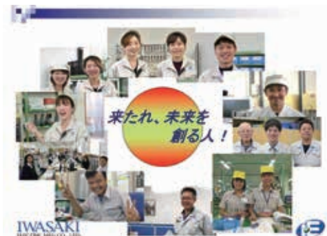
来たれ、未来を創る人！