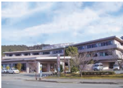
丹波市山南町にある「さんなん桜の里」

社会医療法人社団正峰会は、平成5年に西脇市黒田庄町で大山病院を開院して以来、「地域とともに、あなたと生きる。」を基本理念に掲げ、医療・介護活動を行ってきました。