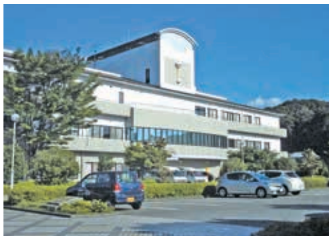
1998年開設の介護老人保健施設 咲楽荘

「地域に根ざした誠実でより良い医療・介護の実践」を法人理念にかかげ、岡本病院を母体に、市内で初めての老人保健施設を開設し、訪問看護・居宅介護支援・通所リハビリ・通所介護4事業所・小規模2事業所・グループホーム5事業所を展開、医療と介護の現場が協力・連携を図り、ご利用者・ご家族のためのサービス提供に努めています。また、三田市、丹波市、京都府八幡市にも介護施設を開設し、利用ニーズに応えられるよう日々活動しています。