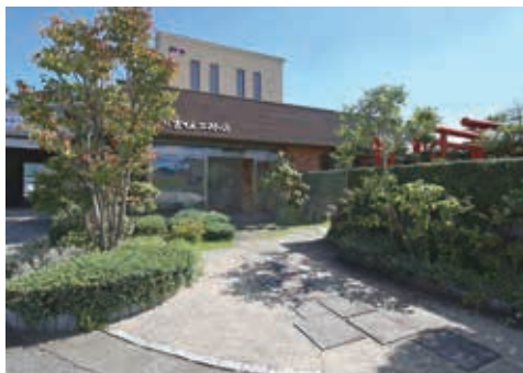
本社を拠点に幅広く工事を手掛けています

当社は平成28年に創業75周年を迎え、丹波を中心に大規模建築を軸とする事業活動を行ってきました。公共施設の新築・改修、工場や福祉施設、商業施設などの民間工事、学校関連施設や医療施設の工事、各種耐震補強工事など数多くの実績を積み、阪神間にも住宅事業の展示場を建設、西宮市を拠点に無垢材や自然素材を採用した木造注文住宅や、ゼロエネルギー住宅の推進にも積極的に取り組んでいます。当社が目指すのは、建物が完成した後もお客様との絆を大切にできる人間味あふれる会社です。「真実一路」を社是に、規模や内容に関わらず、ひとつひとつ丹精を込めた仕事をするという姿勢で、みなさまのお役に立てる企業として日々努めています。