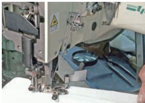
組立工程 モノづくりの醍醐味が味わえます

今年で創業50年目に入りました。当社は、「ヤマトミシン」というブランドの特殊工業用ミシンを生産しています。ヤマトミシングループでは、マザー工場という重要なポジションを担っています。特殊工業用ミシンは一般家庭用ミシンの10倍もの高速回転を必要とし、機構部品には1000分の1ミリという高精度が求められる精密機械ですが、長年積み上げた高度な技能とノウハウで高品質ミシンづくりを支えています。社員たちはこうしたハイレベルのモノづくりに日々取り組み、技術者として醍醐味や、やりがいを感じています。