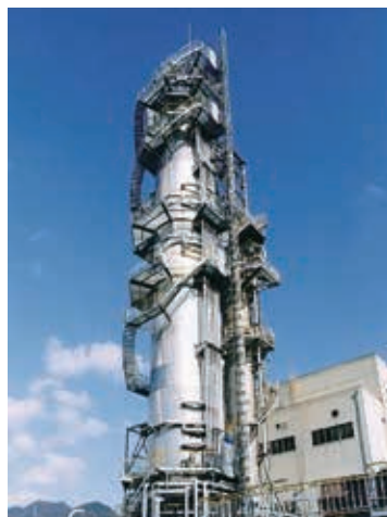
原材料の木材チップを炊く釜です

パルプ生産工程で発生する、パルプ蒸解廃液(黒液)とリサイクル材・未利用材を燃料とした2基のバイオマス発電設備により、バイオマスエネルギーの社会への供給を行っています。