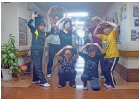
愛の心で人と地域に愛の架け橋づくり「和」

老後は健康で生活の豊かさが実感でき、幸せに暮らせることが誰もの願いです。家庭的な雰囲気をお大切に、基本理念「愛の心」をもとに、安全安心な日々の生活をお過ごしいただき、ご利用者様お一人お一人の個性や生活のリズムに沿った介護と日常生活でのお世話、機能訓練等を行っています。また、施設域内の「クリニック」との連携で福祉と医療の一体化によるさらなる安心と心温まる一味違う品質サービスで思いやりと信頼の架け橋、シフトサービスで日々楽しんでいただく支援をいたします。