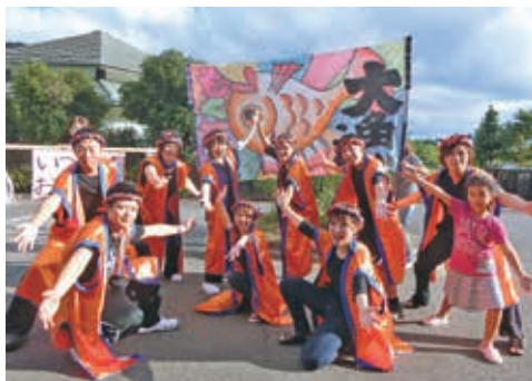
利用者の方の楽しみである行事の写真です

職員の年齢は様々ですが、若い職員が増えてきており、男性職員も活躍しています。当施設はワークライフバランスを大切にしており、育児などの「家庭」と「仕事」の両立をしながら働く女性職員が多くいます。