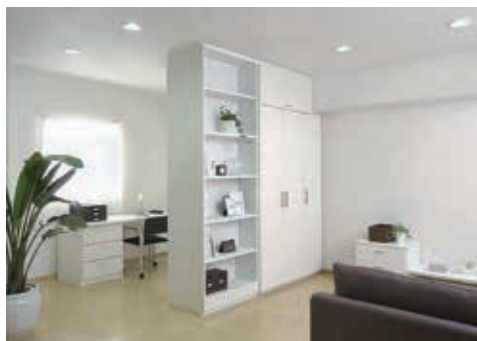
人と暮らしを豊かにする感動をお届けします

オーリスは、クローゼットや玄関収納、洗面カウンターなどのシステム収納家具を、自社で開発、製造・販売までを手掛けるメーカーです。