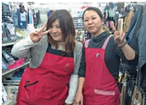
地元店舗のスタッフです。共に働きましょう

昭和32年、日用雑貨問屋として創業。昭和37年、株式会社として法人化。以来、皆様のお役に立ちたい一心で作業服、作業用品の小売へと業種を変更し、おかげさまで法人化55年を迎えさせていただきました。