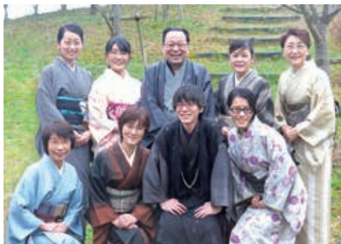
20代から60代まで、みんな明るく元気な仲間です

創業98年目『きものほそみ』として、丹波市、朝来市、舞鶴市に出店しています。成人式の前撮りをする『フォトスタジオ遊』も展開しております。我が社の仕事は、単にきものを販売することではありません。きものを通じてお客様に和の文化をお伝えし、感動、幸せを提供します。人生の節目節目で着るきもの、ご家族様の一生の思い出作りのお手伝いができる素晴らしい仕事です。社名にもあるように、我が社の目的はお互いの幸福（しあわせ）をつくることです。お客様はもちろん、取引先様、そして私たち社員とその家族、みんなまで幸福（しあわせ）になることです。そのためにも、私たち自身成長を続けていきます。