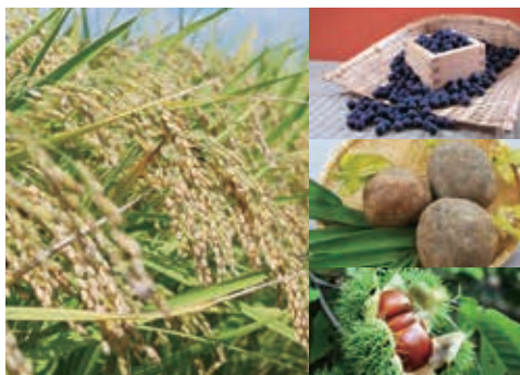
安全・安心なブランド農畜産物を提供しています

農協は「相互扶助」の精神のもとに、組合員の農業経営と生活を守り、地域のみなさまとともによりよい暮らしを築くことを目的とした協同組合です。営農、生活アドバイザーとしての指導や事業、JAバンクの信用事業、生命と財産を守る共済(保険)事業、生産・生活資材を共同購入する購買事業、農畜産物の販売事業、農機具・自動車販売の経済事業、地域に貢献する利用事業、介護サービスを行う高齢者福祉事業、資産管理事業等を実施し、豊かな地域社会の実現に取り組んでいます。