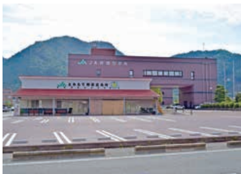
J A丹波ひかみ本店外観

地域の方々や組合員の皆さまとの「ふれあい」を大切にし、「期待と信頼」「経営改革の実践」「地域社会への貢献」を基本姿勢に営農経済事業、信用事業、共済事業の総合事業を展開しております。