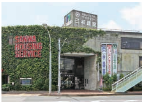
宝塚市旭町の本社社屋 CIマークのツタが目印

宝塚を中心に、阪神間でご愛顧いただき53年。地元密着の建設会社として、戸建住宅（木造、鉄筋コンクリート造）、マンション、テナントビル、教育・医療・介護施設等、幅広い建築の提案、設計、施工を行い、不動産仲介、賃貸管理、リフォームに至るまで、あらゆるご要望にお応えしています。堅実に無借金経営を継続し、西宮、伊丹に住宅展示場を出展。2018年1月には、楽しい暮らしを体感していただくことが出来る大規模ショールームを備えた5階建の本社新社屋が完成。