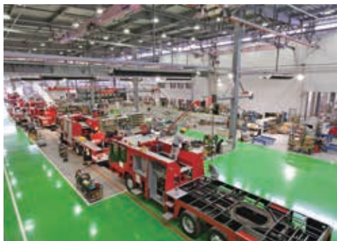
工場内の作業風景です

総合防災企業(株)モリタホールディングスのグループ会社です。主な業務内容は消防はしご車をメインとする消防車両のメンテナンスやアフターサービスおよび制御装置の製造販売です。