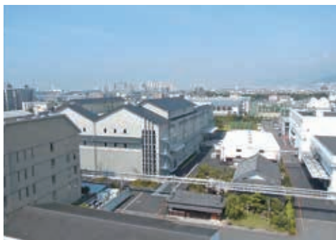
左：本社、中央左：瓶詰工場、右：醸造工場

清酒「白鹿」の醸造元で、江戸時代寛文二年（1662年）から350年以上にわたり西宮の地で本業を変えることなく日本酒を造りつづけています。