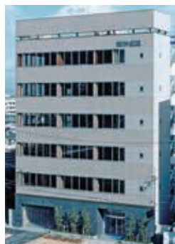
西宮に本社のある冷凍食品メーカーです

当社は、世界中の農水産品を自社工場で加工し、シーフードミックスやイカリングフライなど魚介を中心とした冷凍食品を皆様に提供しています。単においしいだけでなく、安全・安心できる新鮮な商品作りにこだわり、徹底した品質管理体制の工場で生産しています。