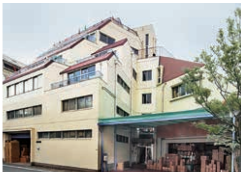
阪神・淡路大震災も乗り越えてきた本社

創業は昭和3年。靴下製造販売一筋で90年の歴史があります。本社工場へは毎年、市内の小学生が社会見学の場として訪れ、一本の糸から靴下が出来上がるまでを見学しています。古くからの機械を使い、職人による手作業の工程も多く見られるのが特徴です。毎日履いている靴下が作られていく各工程に、みんな興味をもって見学していきます。