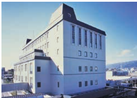
大関の本社工場です

大関は清酒製造販売において300年以上の歴史を誇り、この長い歴史の中で培われてきた さきがけ 魁精神と技と知恵の結集により楽しい暮らしのあり方を提案し、未来を展望する生活文化の創造に貢献する事を企業理念としています。主力商品は発売から50年以上を経過した、手軽に飲めるワンカップ大関です。