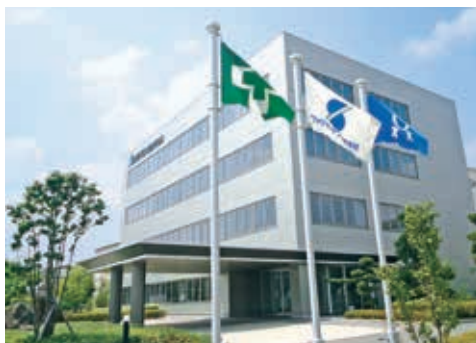
セツカートン(株) 本社および伊丹工場事務所棟

私たちセツカートン株式会社は、1947年に段ボール原紙等の板紙製造を目的として創業した旧セツ株式会社の段ボール部門を継承し、1999年3月に設立されました。