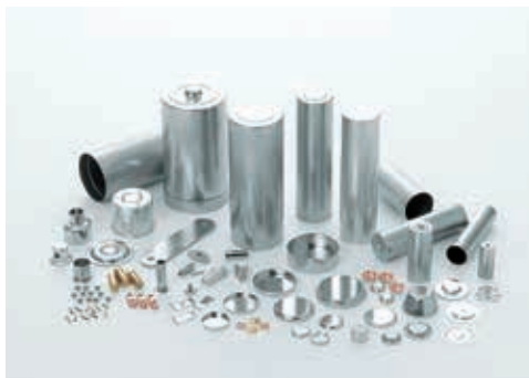
当社が製造している電池外装缶をはじめ、様々な精密部品

当社は1931年国内初のスナップ ぼたん 釦メーカーとして操業を開始いたしました。現在は電池・電子・車載用部品などの精密金属プレス加工メーカーとして、精度の高い仕事の特徴です。得意とする「絞り加工」は、加工技術の中でも独特のノウハウが必要な分野で、様々な「特許」も取得しております。また、金型設計・製作から製品の製造・販売まで、自社での一貫対応が出来る当社ならではの様々な提案が可能です。