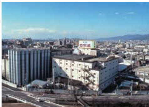
西宮本社工場から全国へ清酒を出荷しています

創業126年を超える清酒「日本盛」の蔵元である酒造メーカーです。丹波杜氏の伝統の技と最新の醸造技術の調和が生み出す新しい酒造りに挑戦しています。これまで非常にデリケートで品質管理が難しいとされてきた「生原酒」をボトル缶にて発売。 また、酒造りのノウハウを活かした自然派基礎化粧品「米ぬか美人」シリーズや健康食品の企画・販売にも力を注いでいます。 ものづくりだけに終わらないお客様へのサービスや新しい施策の提案・企画・開発を行っていき、「もっと」成長できる企業を目指しています。