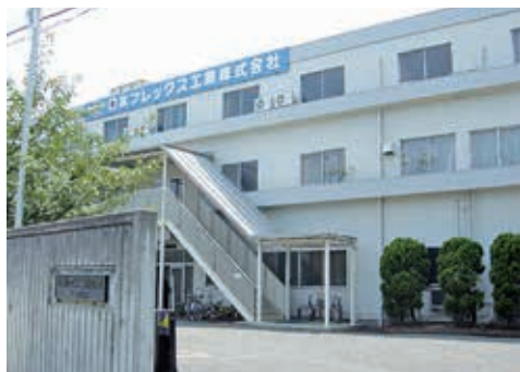
<本社・伊丹工場> JR伊丹駅から徒歩7分です

私たちはコントロールケーブルの専門メーカーとして、兵庫県伊丹市にあります本社・伊丹工場をはじめ、山崎工場（兵庫県宍粟市）、関連会社のニチフレ千草（兵庫県宍粟市）、ニチフレ島根（島根県飯南町）の各拠点より、世界に通用する優れた製品を開発・供給しています。その高性能・高品質のコントロールケーブルは、自動車をはじめ自転車や農業機械などの分野で重要な機能部品として利用されています。そして「吾々は、フレキシブルケーブルの新たな付加価値を創造し、そのマーケットの第一人者となる」の経営理念のもと、医療・福祉機器や事務機器、鉄道といった新たな分野へ挑戦することで、コントロールケーブルが持つ無限の可能性を広げていきます。