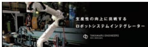
生産性の向上に挑戦するロボットシステムインテグレーター

高丸工業(株)は、1985年からロボットメーカーにこだわらない独立系システムインテグレーターとして、各種産業用ロボットシステムの設計製作やロボットシステムの導入支援を行っている会社です。