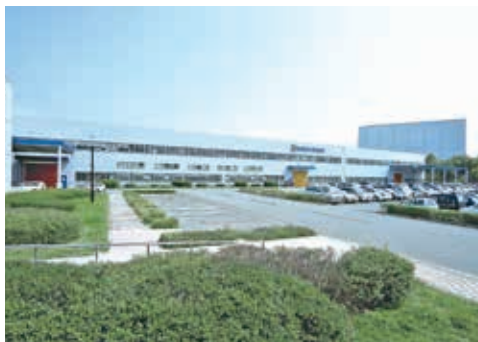
兵庫本社及び本社工場の外観

当社は創業以来、業務用電気厨房機器に特化して「食」業界の発展と共に歩んできました。全国展開の有名外食・コンビニチェーン店や、有名ホテル・スーパー・医療福祉施設・学校などに製品を提供しています。