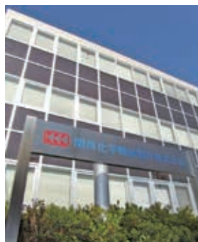
本社管理棟：太陽光発電を壁に施工して省エネ

関西化学は溶剤の回収、精製に使われる蒸留・蒸発・抽出・晶析などの技術を用いた分離精製プラントや酵母・酵素・アルコール生産などのバイオプラントを中心に事業展開しているプラント・エンジニアリングメーカーです。プラントの設計、製作、施工、試運転まで一貫して行っています。プラントの効率を上げるために、お客様のニーズにマッチした装置やシステムを多数開発してきました。例として、高性能蒸留塔（リフトトレイやチェンジトレイ）、溶剤回収で高い省エネ効果を発揮するウォールウェッター、多室蒸発装置などがあります。これらは化学工学会学会賞や分離技術賞、発明大賞、科学技術長官表彰などを受賞しています。