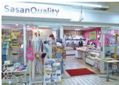
ケーキなど法人製品の直売店「SanQ」

宝塚さざんか福祉会は、1977年に設立された法人で、知的障がいのある方を支援する施設等を運営しています。