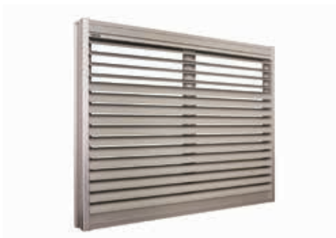
全国のマンションに取付けられている当社製品

当社は1966年10月に尼崎で創業し、2016年に50周年を迎えました。住まいの「安全・安心・快適生活」をキーワードに、マンション向けのオリジナル製品を自社開発している建材メーカーです。「トビデール」や「ツバーサ」といった多くのヒット商品を生み出し、全国に向けて販売しております。大手デベロッパーや大手ゼネコンとの太いパイプを活かし、多様化するお客様のニーズに応えた新製品開発に取り組んでおります。さらなる50年に向け「Try to Challenge」をスローガンに新しい事業領域に挑戦していきます。