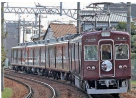
網延橋駅～滝山駅間を走行する5100系車両

当社は1908年に能勢妙見宮への参拝者と能勢地方の産物の輸送を目的に創立した会社です。