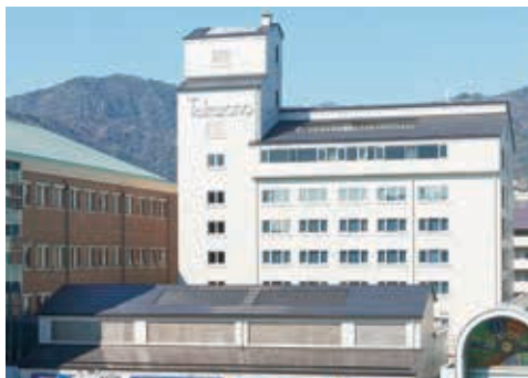
「ホテル竹園芦屋」の全景

1946年に但馬牛専門の精肉店として創業以来、ホテル事業、レストラン事業も展開しています。精肉店は芦屋本店の他、『阪急百貨店うめだ本店』内にも出店しており、長年継承されてきた職人の目利きと技術による“こだわり”のお肉を提供しています。ホテルは芦屋の玄関口であるJR芦屋駅前に立地し、地域コミュニティの場として地元の皆様にもご支持をいただいております。