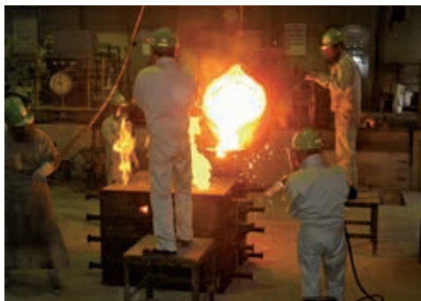
神崎サマダ工場にて製造中の様子