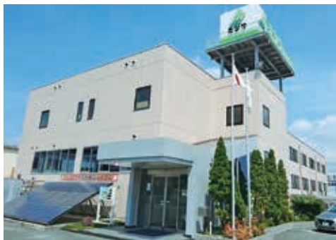
川西市に本社、丹波市と神戸市北区に支店があります

私たち株式会社ミツワは、約60年前に薪や炭など固形燃料の販売から商売を始めました。そしてガソリンスタンドやLPガスの販売に移行し、お客様を広げていきました。今では、太陽光を含めた総合的なエネルギー提案とともに、リフォーム事業、バナジウム天然水の宅配事業、ドコモショップの運営、販売から車検・整備・钣金まで全部任せいただけるカーライフ事業など、暮らしの中で必要な商品は何でも提案できる充実したラインアップです。2015年には初めての飲食事業として、カフェ珈乃香（かのか）をオープンし、続いて2017年、2号店となるKANOKAオアシスタウン伊丹鴻池店をオープンしました。これからも常にお客様のご要望にお応えできるよう努力していきます。