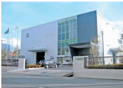
エコガラス（複層ガラス）生産：空港第1工場

創業以来、強化ガラス・建築用ガラスへの需要に的確に応えるため、製品品質と機能向上に注力してまいりました。強化ガラスドア国内シェアNo.1企業として、人と環境に配慮した高機能性に加え、高い安全性と次の世代につなげるエコロジーな製品作りに取り組んでおります。