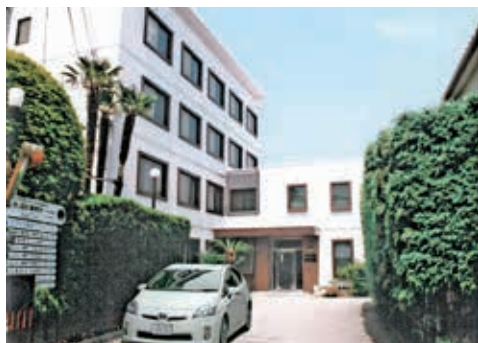
環境と調和の新空間を創造する技術者集団

(株)宮本工務設計事務所HDの、建築設計部門と補償分析部門の全てを(株)宮本設計に、土木設計部門と測量設計部門の全てを(株)アーク設計に移行。73年の伝統と実績全てを分社し引き継ぎさし、関連会社を含む6社からなる総合設計事務所です。住宅設計から公共建物・教育施設・福祉施設等の設計、測量設計から街づくり設計まで幅広く専門組織として地域社会に貢献し、おかげさまで官公庁・民間等多方面の方々にご愛顧いただき感謝しております。また、阪神大震災に際し、被災地内にある当事務所半世紀の作品(大型物件約1000件)においては、ほとんど被害はありませんでした。CADのパイオニア(3次元)AIに向かって努力中です。