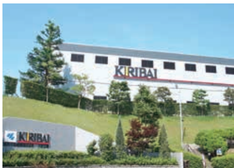
豊かな自然、美しい景観、冬のお供にきりばいはる

「人と社会に素晴らしい『快』を提供する」という経営理念に基づき、「ISO9001」「ISO13485」の厳しい品質管理のもと、より良いカイロを製造し供給するだけでなく、周辺地域の環境整備やエコ活動を行い、良き企業市民として『あった快』を皆様に提供していきます。