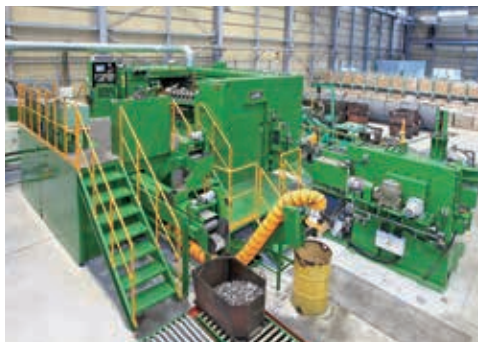
大型生産設備（冷間圧造フォーマー）

高層ビルや橋梁の骨組みをつなぐ。機械や自動車の部品を取り付ける。私たちの作るボルト、ねじや各種の部品は生活の至る所で世界を支えています。材料である鋼線から、完成品まで一貫生産出来るのが私たちの強みです。2017年、大阪のグループ会社の生産設備を三田工場に集約し、本格生産を開始しました。2017年からは隣接する新工場で、ボルトの相手部品であるナットの生産も開始し、今後も生産の拠点として拡張を続けます。