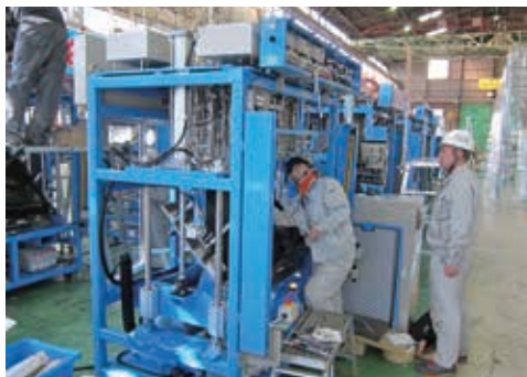
製品の完成間近です。最終チェックは期待と緊張の瞬間です！

尼崎工作所は100年を超える歴史の中で、時代とともに進化し、お客様のニーズと最先端の技術に応えることで総合機械メーカーとして成長を続けてきました。