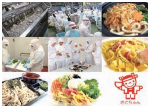
製品と工場内の様子