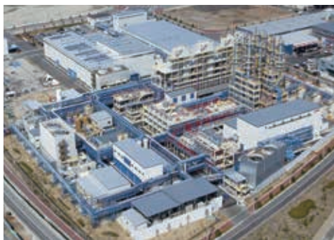
ポリシリコン製造プラントの全景

当社は1952年に日本で初めてスポンジチタン製造の工業化に成功し、業界のパイオニアとして歩み始めました。以来、チタンとポリシリコンという現代文明を支える先端素材メーカーとして、技術開発、ノウハウの蓄積を重ねています。一般的にはまだまだなじみの少ないチタンですが、実は航空機や宇宙ロケット、化学・発電・海水淡水化プラント、熱交換器、建築材料、医療機器からスポーツ用品や眼鏡のフレームまで、私たちの生活の様々なところで利用されています。そして近年、チタンの用途はますます広がっています。当社はチタン・ポリシリコンが秘める素材の力を引き出すトップメーカーとして、その限りない可能性に挑み続けます。