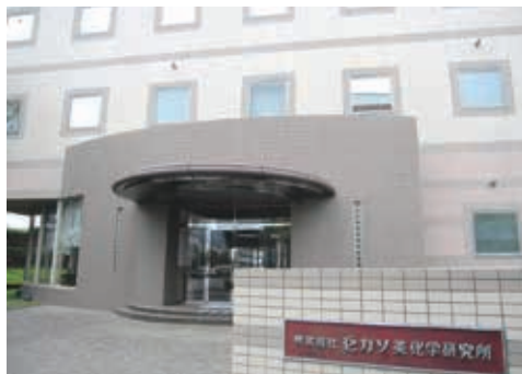
西宮浜の工場には、およそ 300 人のスタッフがいます

当社は創業83年と歴史のある、化粧品のODMメーカーです。ODMとは、取引先企業のブランド商品を当社がゼロから企画提案し製造することです。社名こそ表には出ませんが、店頭販売や通信販売を問わず、誰もが知る有名化粧品を数多く手がけており、実は業界では知名度・シェアともに抜群の経団連加盟企業です。