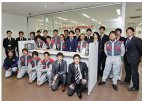
目指せ！地域一番の物流ドクター

自然豊かで多様な産業をもつ兵庫県。私たちのお客は、食品・機械などのメーカーや、物流・倉庫会社など多岐にわたります。そこで一番重要なことは「お客様の現場ニーズ」を把握することです。しっかりと現場を確認・調査して、実際に働いている方々にヒアリングを行い、改善点や効率化できるポイントを洗い出して、お客様にご提案します。