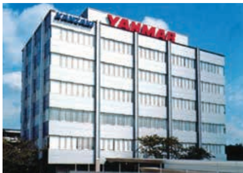
JR 猪名寺駅から徒歩5分の場所にある本社ビル

エンジン、農業機械を主軸に建設、エネルギーなど、さまざまな事業を展開している国内大手企業ヤンマー(株)。そのヤンマーグループの一員として、トランスミッションなどの「動力を伝える」製品を開発・製造しているのが私たち、神崎高級工機製作所です。