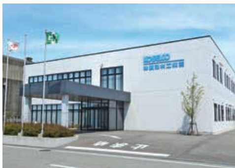
2013年5月 本社所在地内に新社屋が竣工

当社は、神戸製鋼グループの一員として、主に公共事業の分野で、ガードレール等の道路土木製品、落石を防ぐ防災製品等を提供する総合建材メーカーです。