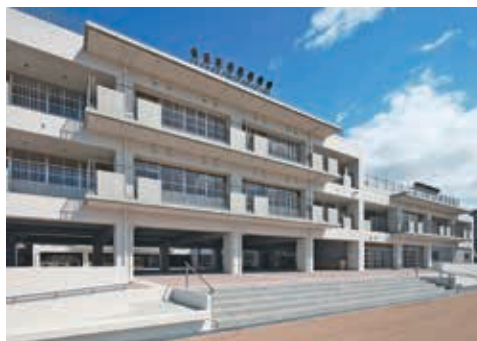
「難波の梅小学校改築工事」建築竣工物件

昭和21年創立以来、お客様との信頼関係を大切に「誠心・堅実」をモットーに、数多くの建設事業を通じて地域社会に貢献してまいりました。この間、建築・土木の事業分野にとどまることなく、鉄工エンジニアリング・デンマークハウス・倉庫物流・不動産事業など関連する様々な分野に挑戦し、今日の「KARATANIグループ」へと成長してきました。これからも「IF」から「TRY」に」のスローガンのもと、チャレンジ精神で変革の時代を乗り切っていきます。