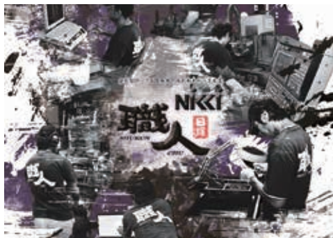
職人と呼ばれる技術で、時代のニーズに応じていきます

弊社は、金属プレス金型の設計・製作・加工会社として、昭和55年3月に創業いたしました。