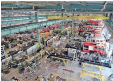
アジア最大級の消防車工場