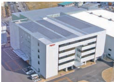
平成20年に新社屋として尼崎市臨海地区に建設

ニブロンは産業用途で活躍する「電源」の専門メーカーです。「電源」とはコンセントの電気を変換する装置で、パソコン・銀行ATM・コンビニPOSレジ・券売機・医療MRI・通信用サーバー・太陽光発電装置など、さまざまな分野の機器に入って、社会全体を電気の分野で支えています。