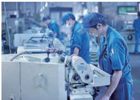
ミクロン単位の作業風景

当社は1946年に創業し、主に大手農機具メーカー様の関連会社向け工作機械を製造しておりました。現在は工作機械に付属する備品で「先端取替式回転センター」を開発、国内外で特許を取得する事によりグローバルな精密機械器具メーカーとなりました。先端が交換できるメリットを利用して、今までにない製品やお客様のニーズに対応した製品を作る事により、低コスト、効率化にも成功しています。