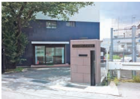
航空宇宙関連部品を発信しています

わが社は、航空・宇宙業界にその高い技術力とノウハウを提供することによって社会に貢献しています。その製品は災害救助や国土防衛の際に活躍する自衛隊などの航空機やヘリコプターの他、様々な部分で使用され、厳密な基準に適合する精密な製品を供給し続ける技術は常に高い評価を受けています。また、宇宙で使用する機材も製作し、高い技術を用いてロケットが大気圏を離脱する際の大きな負荷にも決して負けないパーツを低コストで生み出しています。