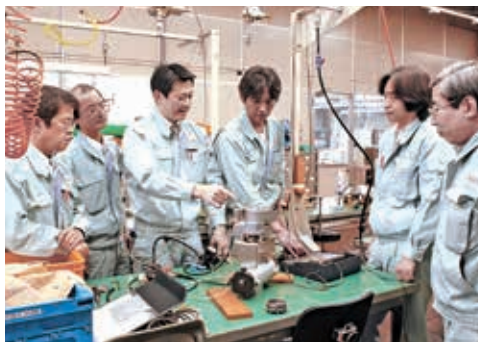
商品開発は、皆で試作品を評価

私たちの会社は、1940年の創業以来、空気圧・油圧をベースとした流体制御技術を用いて、工場や生産設備の自動化、省力化機器を製造・販売しています。