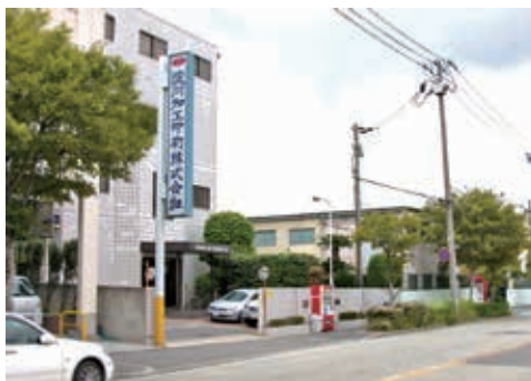
本社で 42 名 近隣コスモ工場 27 名、物流センター 26 名

社長が40代、幹部社員も30代～40代と若い会社です。食品包装用フィルムの印刷加工販売をメインとしており、大手製パンメーカー様と直接のお取引をさせていただいております。