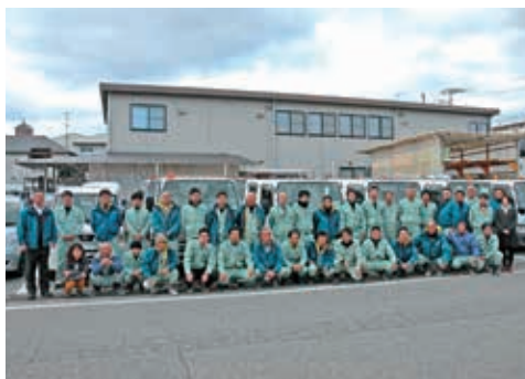
関連会社を含め総勢 32 名で日々活動中です

30年間積み重ねた信頼と実績で、鉄道土木工事・官公庁工事から一般土木工事まで土木・外構・リフォーム・解体工事等を行っている会社です。技術者・職人ともに直営班で仕事をする事にこだわり、安全・的確・誠実をモットーに力を合わせ24時間体制で仕事をしています。土木技術者は営業を兼任し、プランニング・設計・施工管理まで行っており、職人は大工・左官・鍛冶工・鳶・重機オペレーター等幅広く活躍しております。