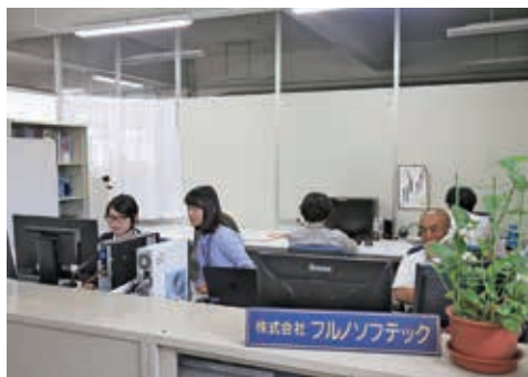
アットホームながら活気あふれる職場です

私たちは1990年5月に古野電気株式会社（東証一部上場）の全額出資により、コンピュータシステムとソフトウェア開発のスペシャリスト集団の会社として誕生しました。