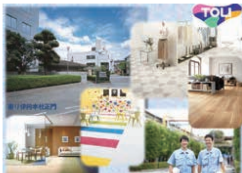
カーペットや壁紙、カーテンなどの内装材メーカー

東りは来年、創業100年を迎えるトータルインテリアメーカーです。タイルカーペットやプラスチック床材の分野でシェアNo.1 を獲得しています。近年では、技術力だけでなくデザイン力も高く評価され、これまでに数多くの製品において“グッドデザイン賞”を受賞してきました。