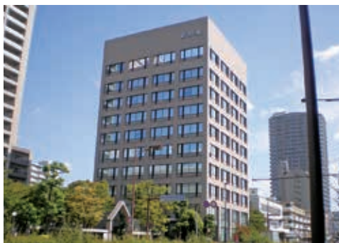
西宮市の国道2号線沿いにある茶色いタイル張りの本社です

新井組は、創業以来「建設事業を通じて新たな価値を創造し、社会に貢献することを誇りとする。」を基本方針の第一に、工場、学校、病院などの建設や、道路、橋梁、トンネルなどのインフラ整備、また阪神・淡路大震災や東日本大震災などの復旧・復興工事など、建設事業を通じて社会のニーズに応え、お客様の満足と信頼を得てまいりました。新井組は、これまで培ってきた技術やノウハウを活かし、自らのフィールド、建設事業で少子高齢化、防災、環境問題など現代社会の抱える多様な問題の解決に取り組んでいます。これからも、もっと豊かな社会づくり、安心・安全な地域づくりの担い手として社会に貢献し続けることを目指してまいります。