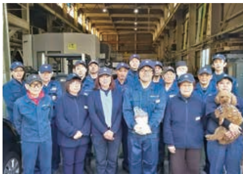
平成29年4月1日 新入社員入社後 集合写真

弊社は創業以来、お客様の要求に即答できる工場、信頼される企業を目指しております。