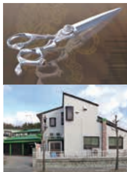
(上) 高級モデル：ティーガ・グレイン / (下) 社屋

当社は理美容専門の鋏メーカーです。宝塚市の築40年近い社屋に、鋏の最終仕上げを施すための業界最高峰とも呼ばれる職人技が凝縮された工場と事務所を構えております。