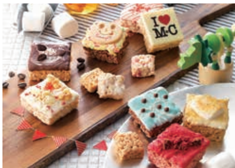
マシュマロを使った柔らかいおこし「Matthew&amp;Chris.P」

『歴史と伝統は守るものではなく、「進化」させていくもの』創業以来200年、当社は挑戦し続けることで歴史を築いてきました。