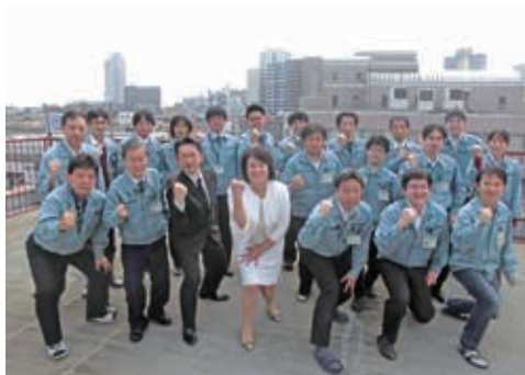
本社屋上 集合写真

当社は技術力と品質の高さで多くのお取引様と長年の信頼関係を構築しています。同時に従来のソフトウェア開発企業の枠組みにとらわれず、様々なメーカーとのコラボレーションを通して、お客様の多様なニーズに応じていくことができるソリューション提供型企业として、日々成長しています。技術者集団の会社として矜持を保ち続けるため、人材教育には特に力を入れています。技術者レベルが一目でわかる保有技術表により、技術を明確にして目標を設定することで、スキルアップに役立てています。これにより社内の意欲的な技術力の向上とモチベーションの維持につなげています。