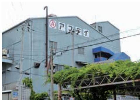
尼崎工場とアマテイ・ブランドのマークです

当社は100年以上の歴史を有する洋釘製造のパイオニアとして釘をつくり続けてきました。今日では、国内のトップメーカーとして「アマテイ・ブランド」は、業界に深く浸透しております。そして、その釘は、主に住宅用や梱包用として利用されており、木が割れにくい釘の特許も取得しております。また、尼崎にある工場では安全第一を優先しながら「1本の釘・ネジで、ものどもの、人と人をつなぎ、豊かな社会づくりに貢献します。」を企業理念とし、全社員が使命感と誇りを持ち、社会から信頼される製品を世に送り出すため、頑張っています。