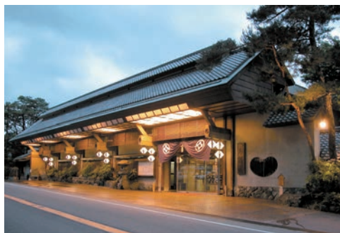
佳泉郷 井づつや 玄関