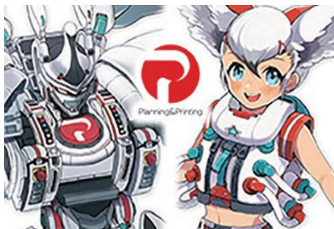
北星社オリジナルキャラ