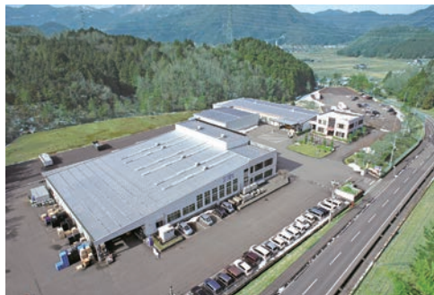
朝来市の工業団地にある兵庫工場