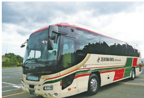
特別仕様の観光バス ZB Premium