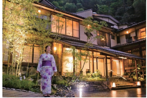
湯楽 -Kinosaki Spa&amp;Gardens- 外観