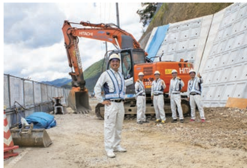
現場監督躍動中!! 若さあふれる頼もしい社員一同