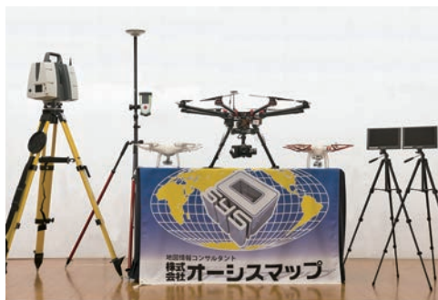
UAVを使用した測量とサービス