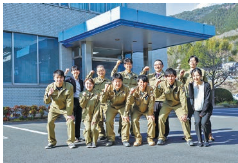
“街と人”がかかわるあらゆる空間を創造します