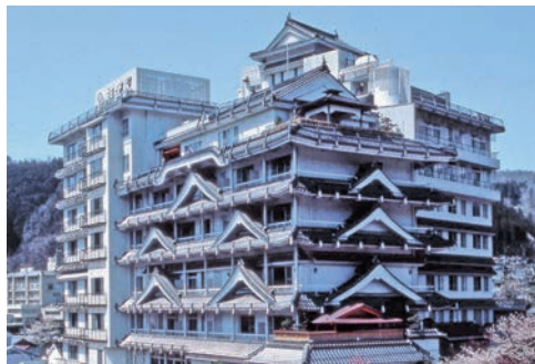
湯村温泉にそびえ立つお城造りの朝野家