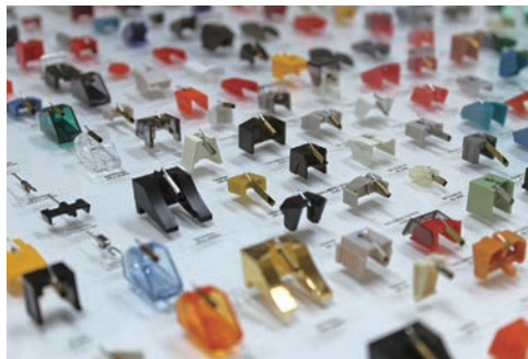
アナログ音楽を支える多種多様なレコード針