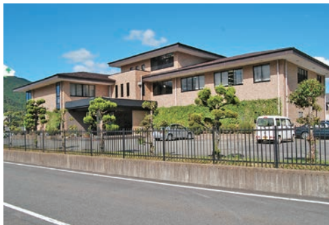
自然に囲まれた本社