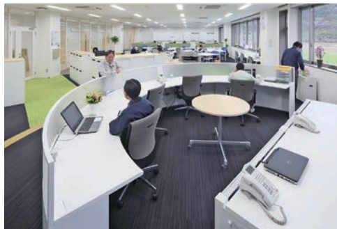
ヒト、自然が見渡せるオフィスエリア