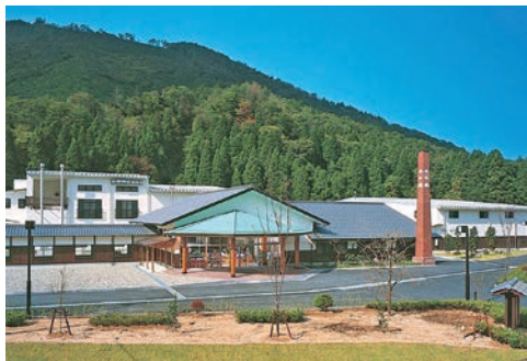
平成15年に完成した新社屋と人気の直売店