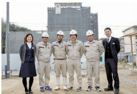
若手とベテランと一緒に活躍できる会社です