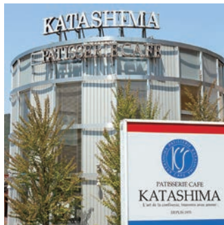
パティスリーカフェ カタシマ 養父本店