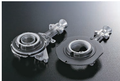
ガスコンロの火が出るバーナー部分です