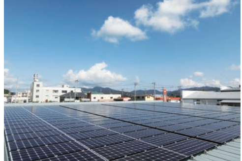
人が「働く」環境において、様々な分野の改善をサポート!