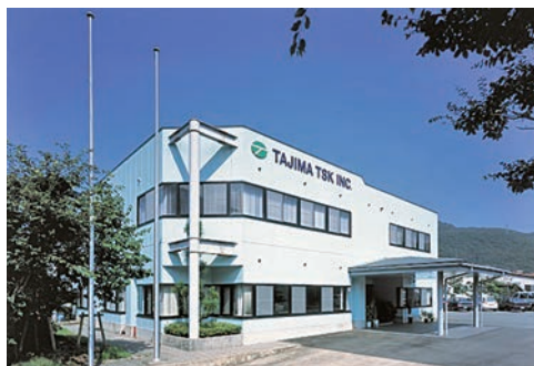
但馬ティエスケイ株式会社