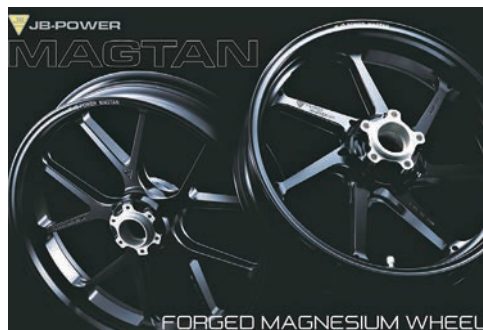
世界最高峰レースで使用される MAGTAN