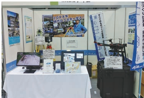
田舎でもだれにも負けない技術がここにある