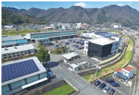
事務所は、2018年7月に竣工