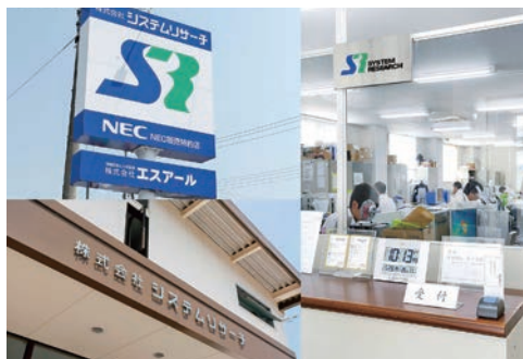
本社社屋(看板・受付)