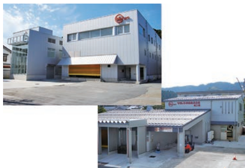
本社事務所・かになど鮮魚系を扱う境工場