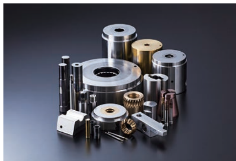
我が社の製品です