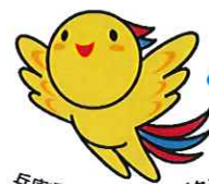
兵庫県マスコットはばたん

兵庫で就職を希望する若者に地元企業の魅力を広くアピールすると共に、若者とマッチングの機会を設けるなど、兵庫での就職と地元企業の人材確保の取り組みを応援します。