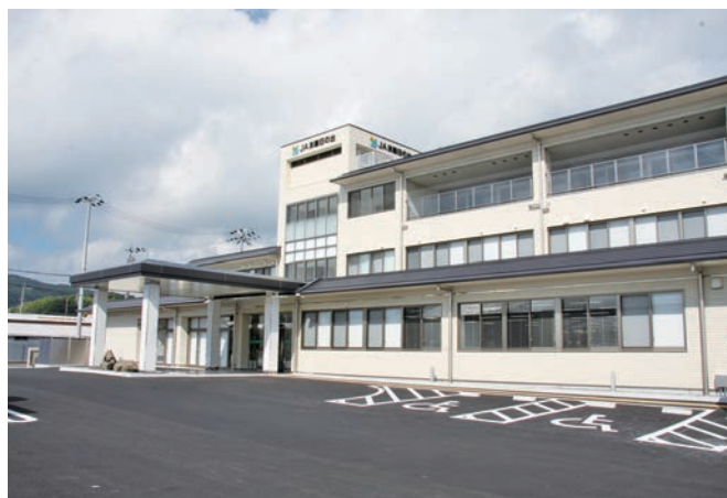
淡路日の出農業協同組合 本店

当JAでは、地域に根ざした協同活動に取り組む、組合員や地域の方々に必要とされる組織づくりと地域貢献活動に取り組んでいます。私たちと一緒に地域農業の振興と豊かな地域社会を築いていきましょう。