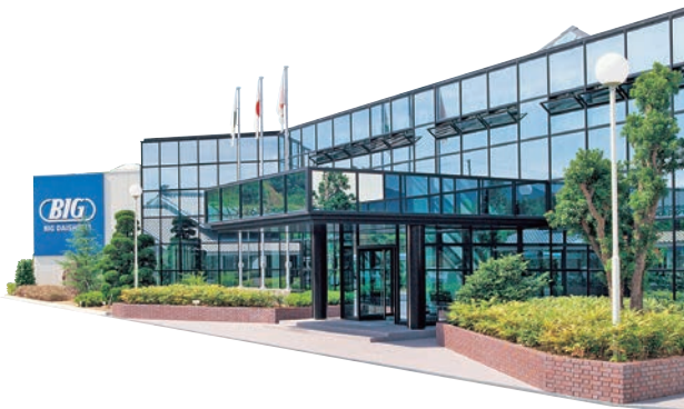
淡路島にある第2工場