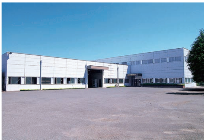
平成26年 一貫生産のため拡張した淡路工場

式に加え、電気、ガス、蒸気などを熱源とするエコ洗浄機をラインアップし、様々な業界で高評価を得ております。洲本製品への需要は今後ますます高まるものと考えられ、市場の期待に応えるよう一步一步着実にまい進してまいります。