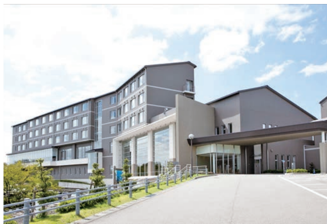
テーマは「自然にときめくりゾート」です

ただ泊まるだけではなく、自然や文化・歴史など、淡路島の素晴らしさを、当地を訪れる人にできるだけお届けすることをモットーに、日々お客様をお迎えしています。従業員寮や各種研修制度も充実しています。