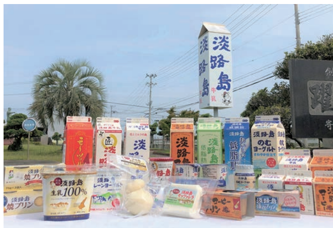
安全・安心な牛乳・乳製品

淡路島牛乳工場は、HACCP（総合衛生管理製造過程）の取得等、品質管理に万全を期しており、「新鮮で安全・安心・安定」をスローガンに、お客様に喜んでいただける製品作りに積極的に取り組んでいます。