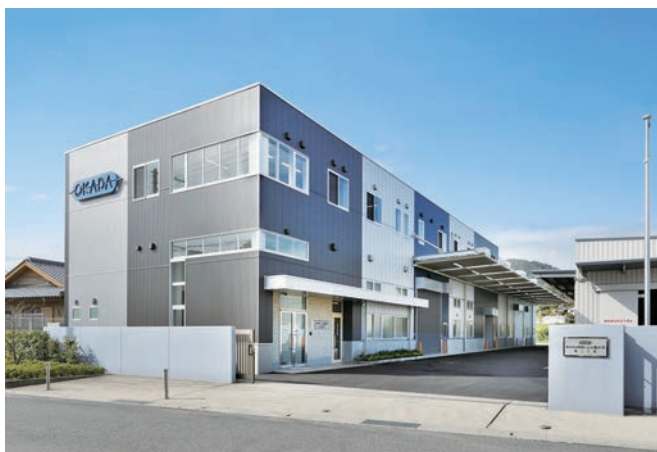
難易度の高い砂型を製造している第二工場

より良い製品づくりに励み日本のものづくりに貢献することで、より従業員を幸せにできる"日本一の砂型メーカー"を目指して全社一丸で取り組んでいきます。