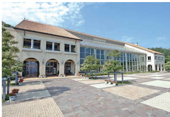
主要施設の淡路ハイウェイオアシスです

また、京阪神地区でもフランチャイズに加盟し、多角的な経営を行っています。特にミスタードーナツや牛角では、若手社員が中心となり新しい店舗の開拓・出店を目指しています。