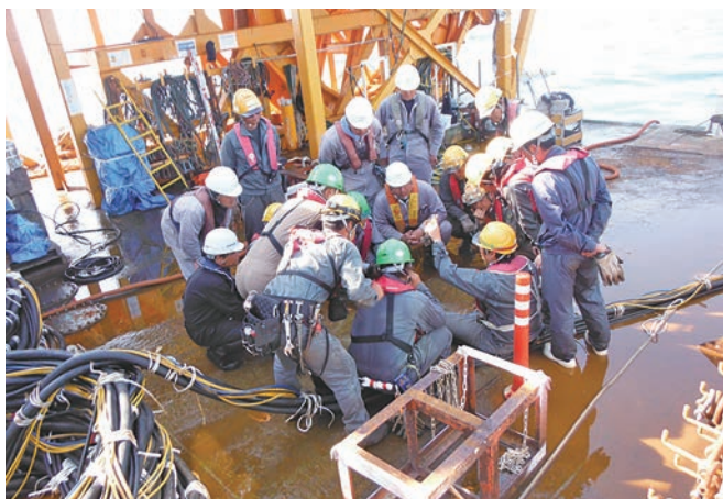
作戦会議 プロの男たちの熱いまなざし

今後は、脱炭素化の未来に向け期待されている洋上風力発電施設の海底ケーブルの敷設、防護工事へも注力し、常に社会から必要とされる企業であるよう挑戦し続けます。