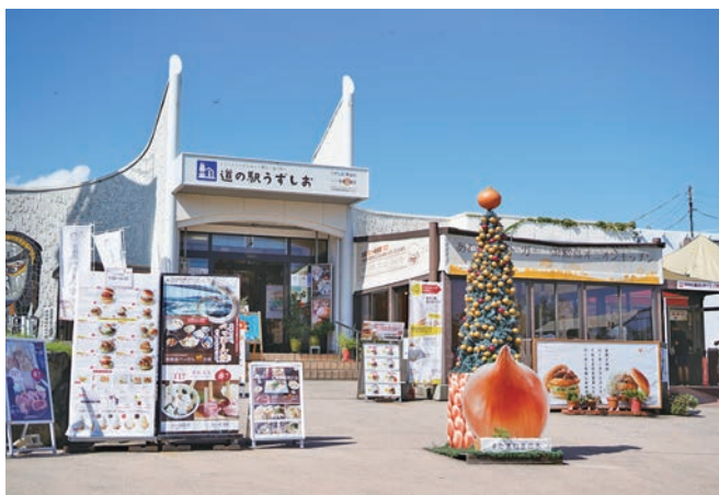
全国1位のあわじ島バーガー本店がある道の駅うずしお

「淡路島にもっと淡路島を」をテーマに、地方ならではの方法で強烈に販促し、「淡路島」のファンになっていただく活動をしています。