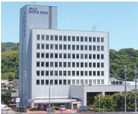
ビジョン「あなたの夢 地域の未来 ともに歩みます」

いった様々な問題を抱えています。それらに立ち向かい、地域の未来にチャレンジしていく。淡路信用金庫ではそんなやりがいのある仕事に取り組むことができます。