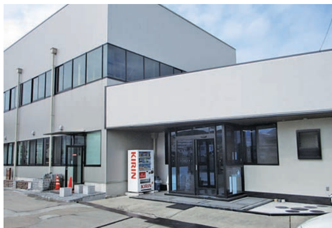
市役所の向かいにある本社工屋