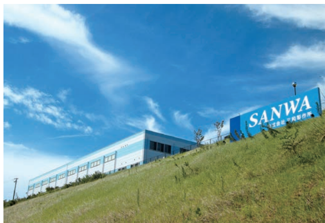
三和製作所 本社工場

ニュースやCMで公開されます。「あの時に自分の作ったモノが」という感動とともに、自分がしている仕事に大きな充実感を感じるようになります。淡路島のきらきら輝く海、青い空につつまれた最高の環境の中で、これから世に出る最先端のモノを私たちと一緒に作っていきましょう。