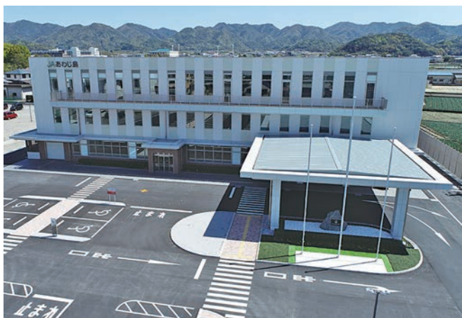
南あわじ農業と産地の発展と農業所得の向上に貢献

作を行い農業産地として成り立っており、組合員が安心安全な野菜を生産しJAへ出荷された野菜を安定的に全国へ食糧供給を行っています。また特産品の一つのタマネギ『淡路島たまねぎ』は42,000トンを取り扱い、ブランド品として全国の量販店や消費者へ届けています。