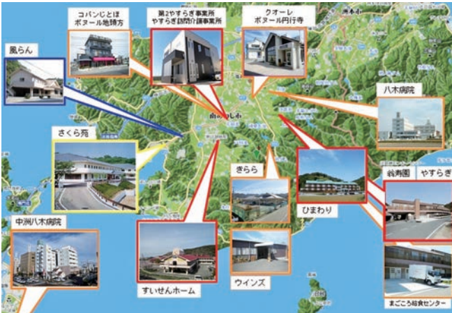
南あわじ市内各拠点で事業を展開しています

めまぐるしく変わる福祉情勢の中で、常に利用者のニーズを把握し、利用者本位の質の高いサービスを提供できるよう、人材育成や福利厚生の実践に取り組んでおり、経営理念である「地域に親しまれ 信頼される 福祉事業所に」の実現のため、全職員一丸となって努めてまいります。