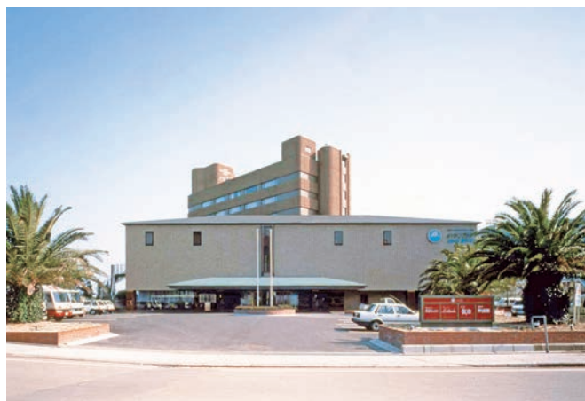
淡路インターナショナルホテルザ・サンプラザの正面玄関

2018年暮れに社員食堂をお洒落 しやれ に改装いたしました。通称「おでんの会」や、社員研修の後の二次会等、社内のコミュニケーションを深めるために利用しています。