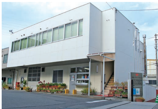
淡路工場の正門です

「人と技術」これこそ私たちの経営のモットーであり、従業員一同の目標でもありません。お客様の厚いご信頼とご要望にお応えし、21世紀の社会へと業界の発展・繁栄のために全身全霊をささげます。