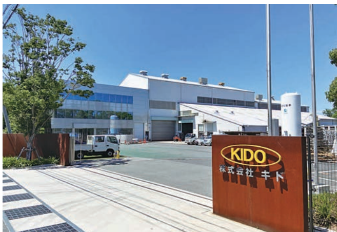
食品業界を中心に医薬品や化学品などあらゆる産業を支えています

トータルエンジニアリング& マニファクチャリングメーカーとして日本が誇る技術を、淡路島から世界へ発信していきます。