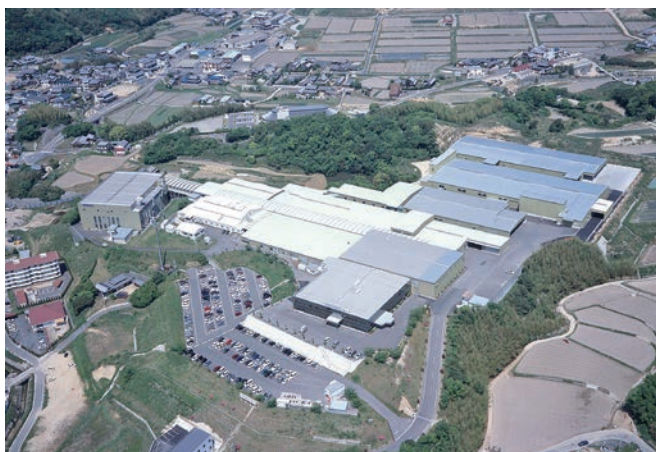
当社五色工場の全景

★IT事業 コインロッカーの鍵として携帯電話番号やICカード等が使用できる機能や、荷物の受け渡しができる機能等を持った次世代型ロッカーの開発・製造