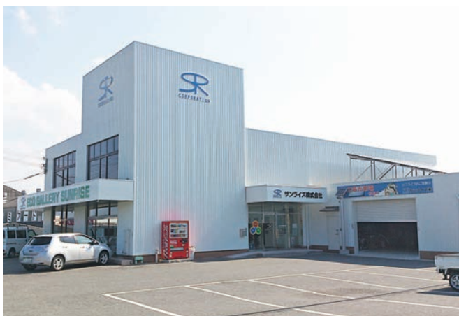
ECOで地球環境を守っていきましょう!

当社は自然エネルギー（太陽光発電）の普及という方法で「カーボンニュートラル」を20年以上前から推進してきた会社です。