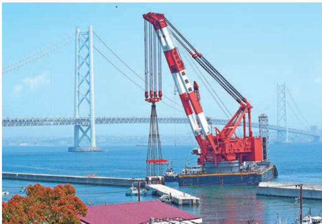
岩屋港にて防波堤工事に従事する第一豊号

フィールドは地球全体にあります。グローバルに活躍できる環境と技術のある会社で、スケールの大きな技術者に育っていくようサポートしたいと考えています。