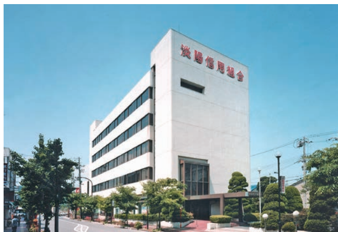
「夢あるくらしのパートナー」として地域の絆を大切にします

淡路島・神戸・播磨地域を営業地域として、「近い、早い、親切」をモットーに地域の皆様とのコミュニケーションを深め、愛され、親しまれ、地域と共に発展していけるよう努力しています。