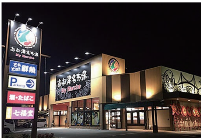
マイマルシェあわ津名市場

「淡路島の食生活をさらに豊かなものになりたい！」そんな思いでスタッフみんな元気に頑張っています。