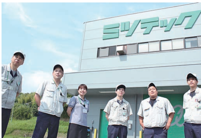
社員が成長できる会社です

また、最も力を入れているのは人材育成です。専門知識の無い新入社員の方にも一から丁寧に指導します。外部研修を受講したり、社内でも勉強会や研究会を開催し、社員が共に学び、共に成長できる機会がたくさんある職場です。