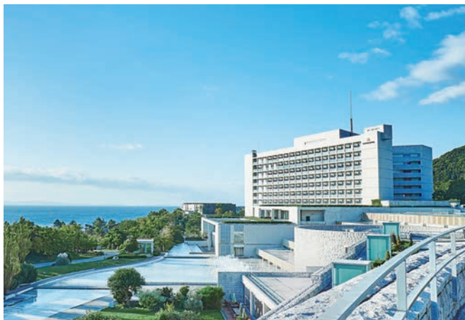
海と緑豊かなロケーションに建つホテル

す。また、レストランでは古来より、朝廷に食材を献上する「御食国（みけつくに）」と称される淡路島の大地の恵みを活かし、季節感あふれる料理を提供しています。来館されるお客様に非日常を感じていただき、最上級のくつろぎを提供するために、『おもてなしの心』を大切にしています。